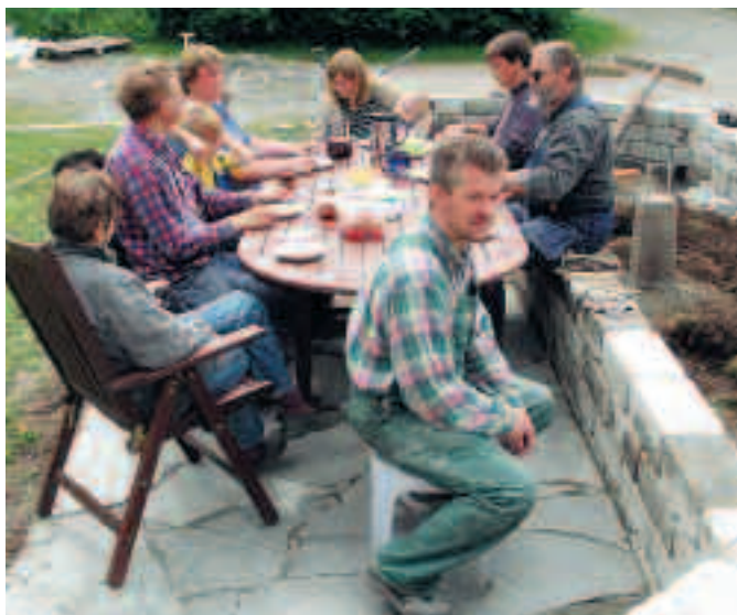
Dags att inviga anläggningen med tårta på Sveriges nationaldag den 6 juni.