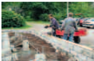
Jordmassor som grävdes bort vid grundarbetet återfylls i botten av rabatten. Dränerande grusig jord placeras närmast muren.