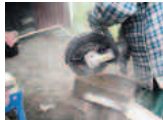
Stensågning är dammigt och fodrar en säker hand.