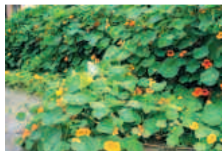
I september syns inte längre muren och sittbänken.