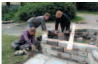
Muren, rabattens ram, är färdig, stenvarven har limmats ihop. Plintarna för kommande "spaljé- pergola" passas in och sätts i jordfuktad betong.