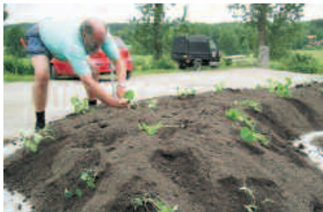
Till midsommar planteras fördrivna krasseplantor av både busk- och slingertyp. Arbetsställningen är inte att rekommendera, men det är föredömligt att inte trampa i växtbädden.

100 lm (löpmeter) eller 260 st Murblock 390x190x140 mm 12 m 2 skiffer 30 lm eller 150 st Marksten 200x33x50 mm 4-5 m 3 makadam 0-30 2-3 m 3 stenmjöl 0-8 50 m 2 geotextil 10 tuber betonglim 6 betongplintar 90 cm 2 säckar cement 10-12 m 3 analyserad planteringsjord Markvibrator och kraftig stenkapp hyrdes in över helgen och en grävmaskin plus förare anlätades i ca två timmar.