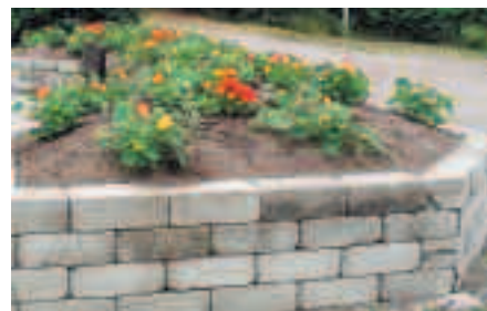
I mitten av juli kom blommorna.