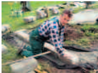
Viktigt att det första stenvarvet blir rätt och i våg.