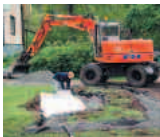
Mycket tid och kraft sparades med denna maskinella hjälp.

Utifrån ritningen gjordes en mängd- och kostnadsberäkning. Material beställdes hem till vår gemensamma arbetshelg i början av juni. Inför denna gjordes förberedelser i form av utsättning, urgrävning och materialåterfyllnad för grundsättning av muren med hjälp av en grävmaskin. Ingen i föreningen var beredd att gräva för hand och mycket tid och kraft sparades med denna maskinella hjälp och den manuella arbetsinsatsen kunde koncentreras på själva byggandet. Den 4 juni satte vi i gång och den 6 juni kunde vi inviga den nya sittplatsen!