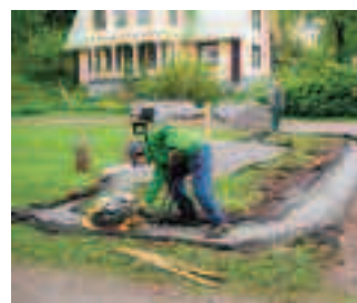
Murens grundsättning komprimeras med markvibrator.