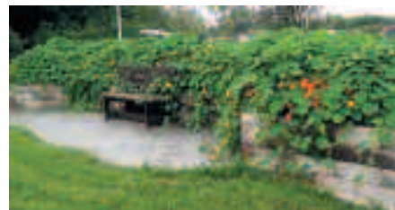
I augusti täcker krassen hela rabatten och det är knappt att bilarna syns från gården.