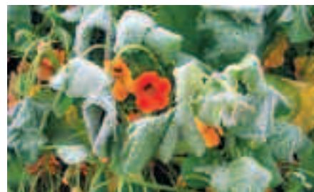
I oktober fryser krassen.

Den totala kostnaden för material och hyror av maskiner uppgår såhär långt till knappt 30.000 kronor. I år ska vi bygga spaljépergola och plantera fleråriga växter i vår nya rabatt och fortsättning följer i kommande Medlemskontakt.