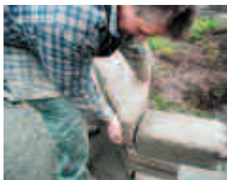
Rabattens vinklar gav merarbete men blev snyggt.